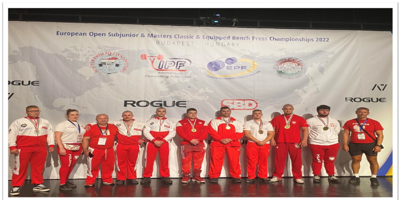
Zdjęcie 2 Drużyna Juniorów wraz z kadrą trenerską